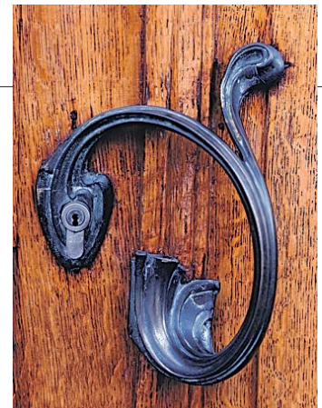
Pomo del museo Victor Horta. J.S.C.

Los amantes de la arquitectura tienen una de sus principales citas en Bruselas, cuna del Modernismo. Sus calles están plagadas de bellos edificios diseñados con el estilo que causó furor en toda Europa a finales del siglo XIX. Por Alicia Arranz