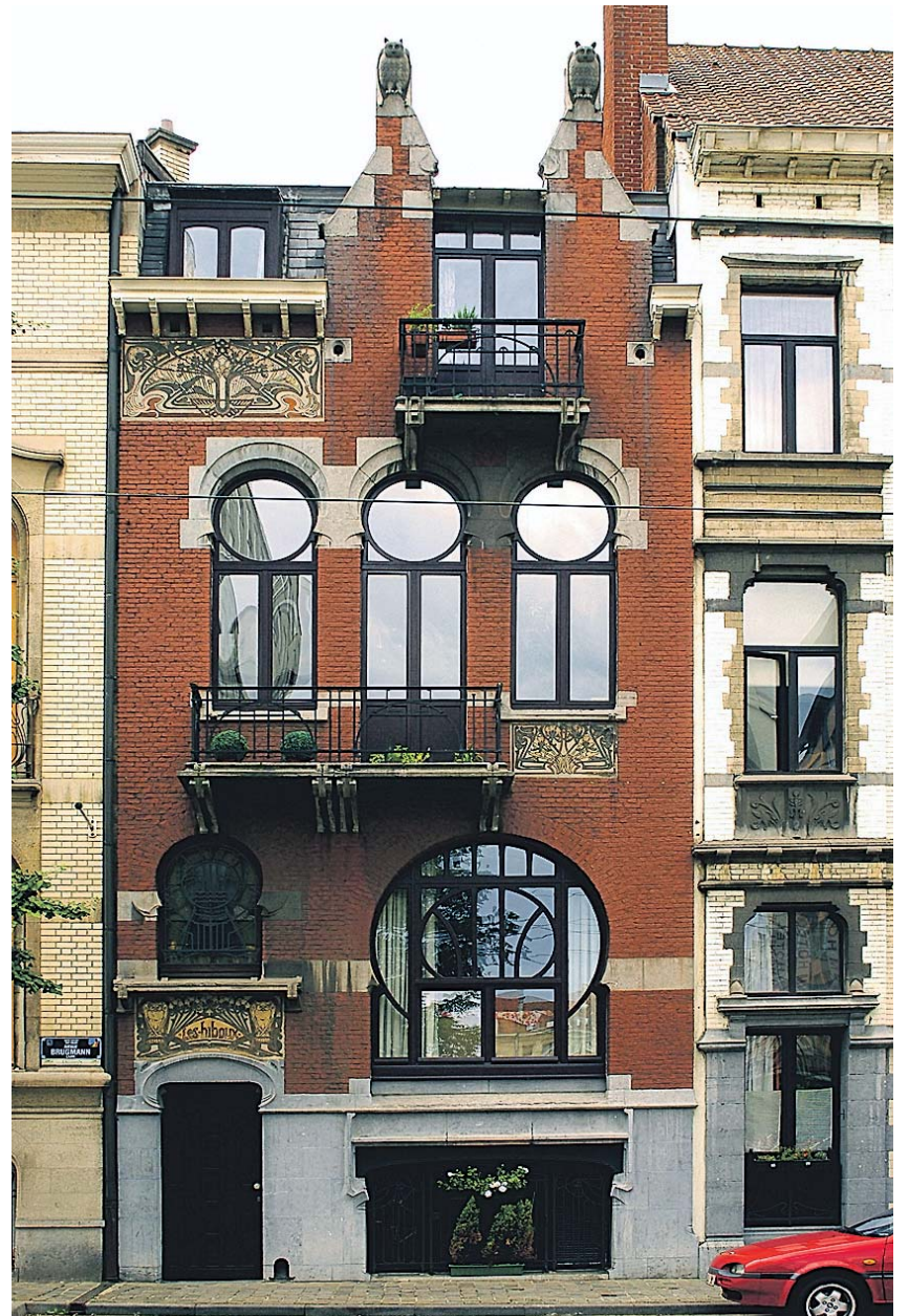
La casa Les Hiboux, de 1895, obra del arquitecto E. Pelsenneer. JUAN SERRANO CORBELLA

(avenue de La Jonction, número 1) es una de las obras más sobresalientes de Brunfaut y una cita tan imprescindible como las anteriores en la agenda de este viaje a la época más romántica de Bruselas. Su embaucador diseño fascina tanto como las exposiciones que programa en el interior la asociación de fotógrafos belga Contretype. Sin salir del distrito de Ixelles, los pasos se dirigen al Hôtel Solvay (avenue Louise, 224) y después al Hôtel van Eetvelde (av. Palmerston, 4), dos im- pagables aportaciones más de Horta.