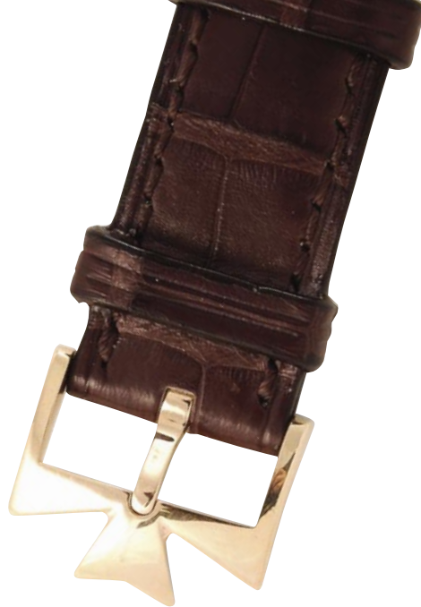
El emblema de la Cruz de Malta fue adoptado por la marca en 1880, y su forma se inspira en una antigua pieza que se fijaba en el barrilete.

En la manufactura, eso sí, existe una voluntad unánime de todos cuantos la integran “por perpetuar la marca pero conservando la identidad de la casa, y ser al mismo tiempo innovador, lo que no significa hacer relojes aso-