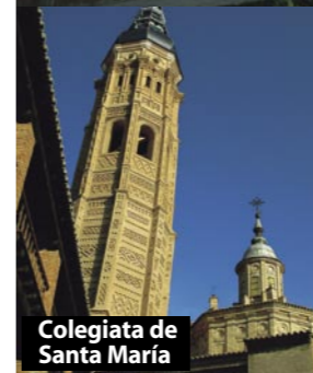
Colegiata de Santa María