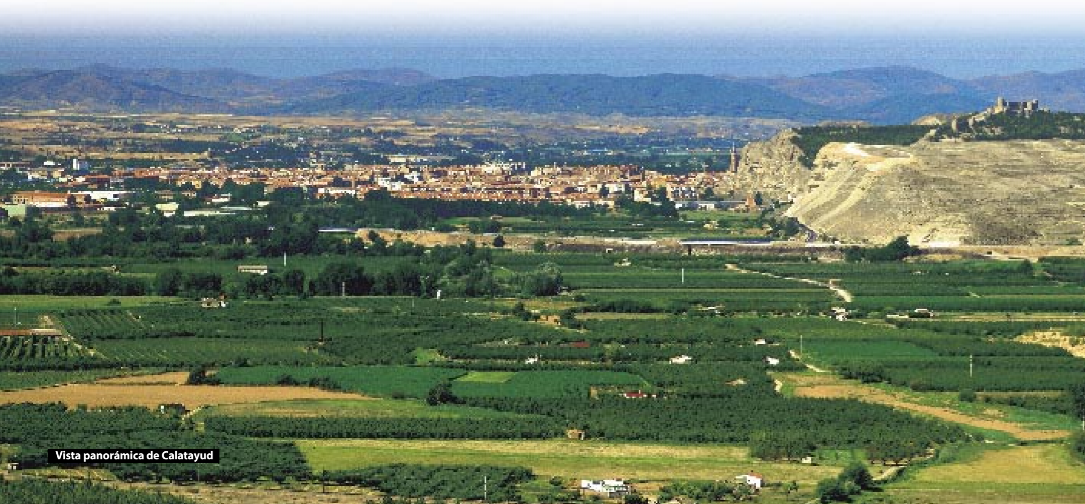
Vista panorámica de Calatayud

monasterio de Piedra, situado a una distancia de 35 kilómetros, es un paraje natural de enorme belleza en el que, después de visitar el Monasterio cisterciense de Nuestra Señora de Piedra (siglo XII), se puede pasear por los senderos que bordean pequeños lagos e impresionantes cascadas. ■