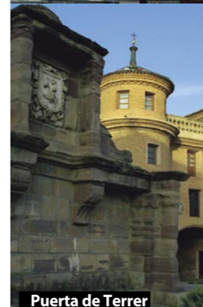
Puerta de Terrer