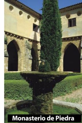
Monasterio de Piedra