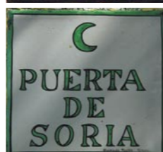
Los símbolos de las calles distinguen los antiguos barrios.