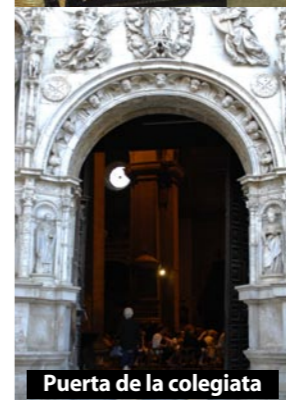
Puerta de la colegiata

histórico, donde los azulejos con el nombre de las calles y plazas tienen pintadas una cruz, una media luna o una estrella para señalar que nos encontramos en el antiguo barrio cristiano, musulmán o judío respectivamente. En este último todavía quedan restos de la antigua sinagoga mayor.