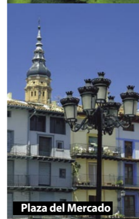
Plaza del Mercado